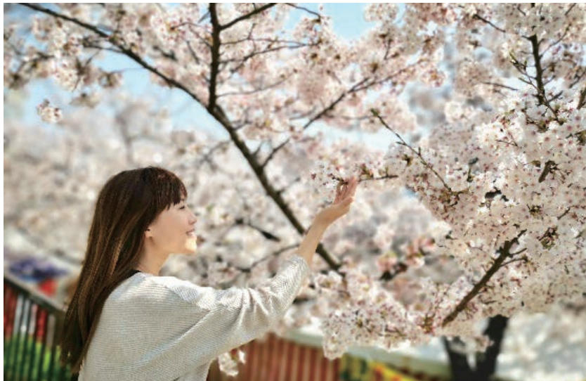
香港新聞社 / 都市日報 MetroDairy 取材の様子@函館市

SPR入居後は、接客に使用できる商談スペースを使わせて頂いたり、業界は違っていますが入居者同士、経営者ならではの悩みを相談したりするなど、環境にはとても満足しております。SPRの仲間と共に、札幌・北海道を代表する企業に育っていきたいと思います。