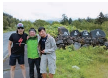
中国江蘇省サイクリング専門会社視察の様子@東川町